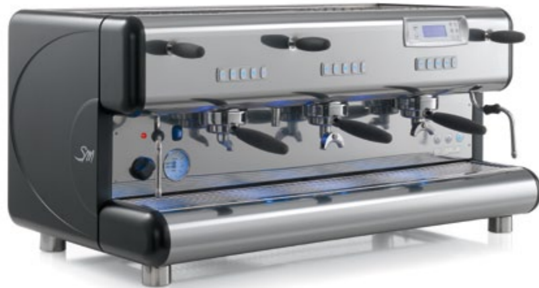
TOP 85 3gr.

TOP 85 uses an ergonomic and functional back-lit keyboard for every group. All keyboards are connected electronically to a graphical display, which integrates the programming performed using the keyboards. This makes additional settings and controls possible and provides a series of information that is very useful for the user.