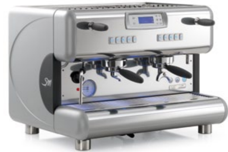
TOP 85 SPRINT

Another new feature is the use of a filter cup holder and steam/water levers with a new handle with an extremely modern, ultra-ergonomic design. TOP 85 is offered in the standard version with a flow variator or in the version with the DTC system, which provides an additional heat exchanger in the brewing unit.