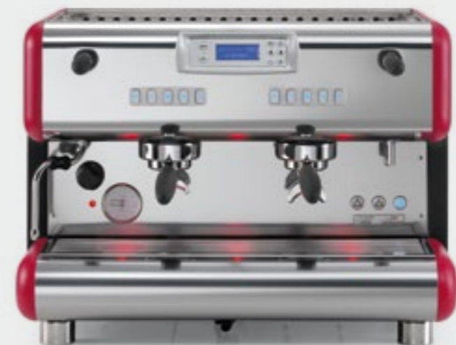
TOP 85 SPRINT