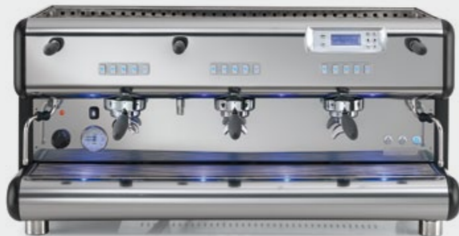
TOP 85 3gr.