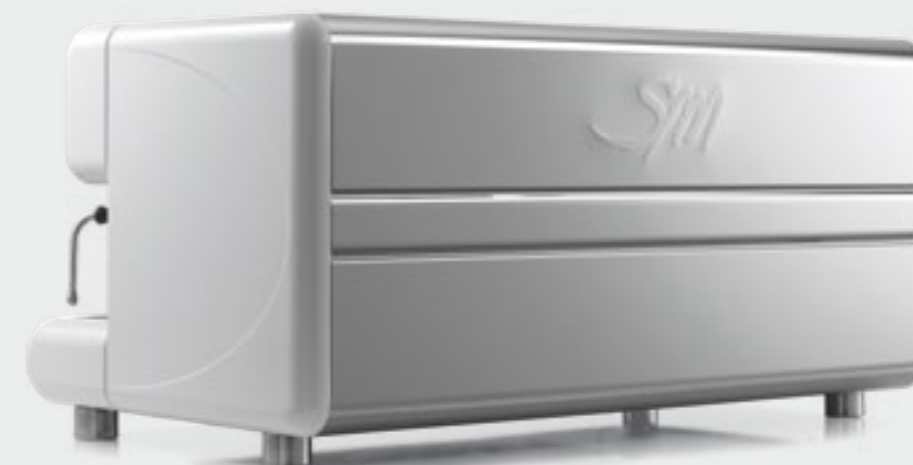
TOP 85 3gr.