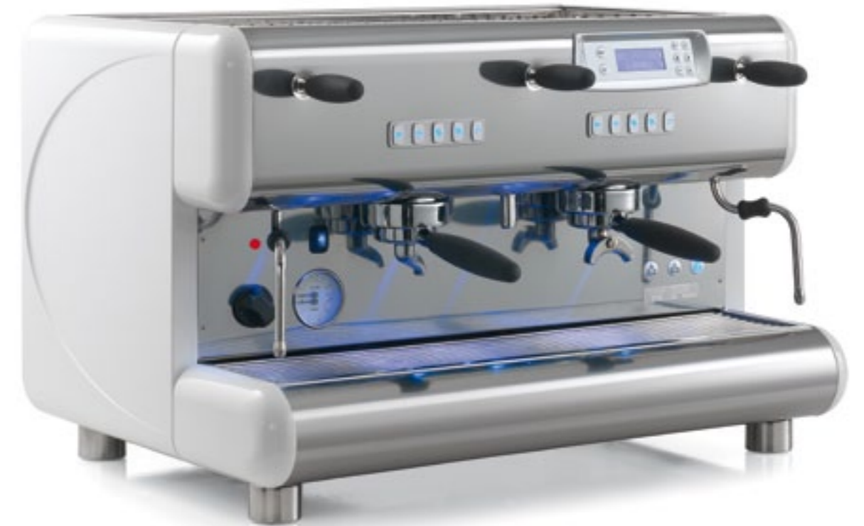
TOP 85 2gr.

TOP 85 represents the technical evolution of the historical and famous Series 85, which is appreciated in Italy and all over the world. In addition to its renown characteristics of robustness and reliability, La San Marco has now added a modern display, an illuminated working surface with multicoloured LEDS and automatic electronic control of the boiler temperature. The new glossy white and satin white colours, together with anti-fingerprint stainless steel, enhance the new look of the TOP 85.